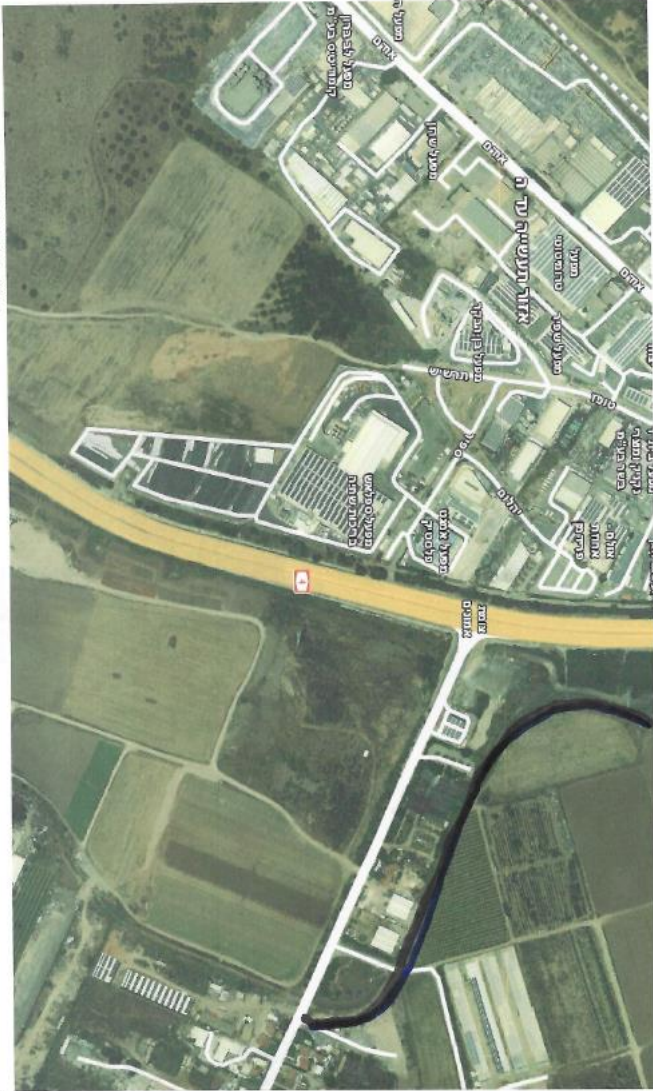
תעלת שדה עוזיה

400m