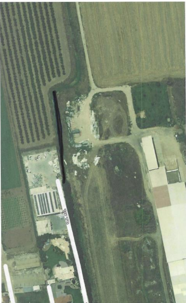
מקטע תעלה בגבעתי