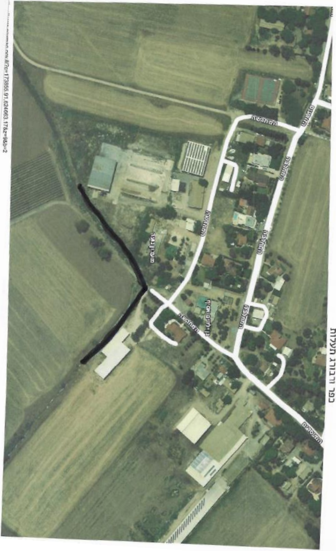
כפר ודבורג מעלות