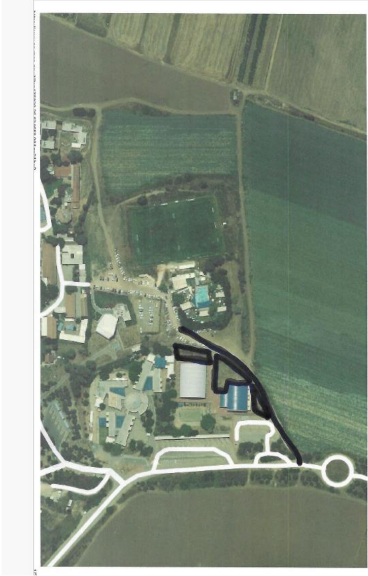
טווח הייטוש מהגגל האום