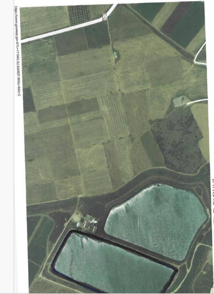
מאגר תאור בריכה מדרחית

https://www.gov.il/7c=171048.52.830027.6818z=4810-2