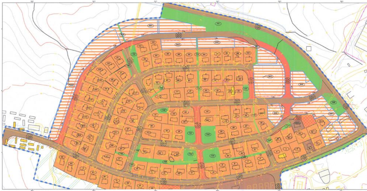
וע"פי תצ"ר 251/2023 ותצ"ר 252/2024

תשריטים מושב תימורים – תכנון הרחבה עפ"י תכנית מס' 5/116/03/8 סה"כ יחידות לפיתוח במסגרת ההרחבה