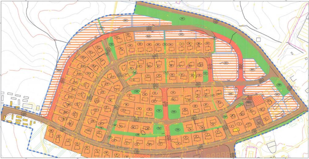
וע"פי תצ"ר 251/2023 ותצ"ר 252/2024